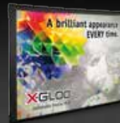
INFLATABLE DISPLAY WALL

IMPRESSUM : by Skywalk GmbH & Co. KG | www.x-gloo.com